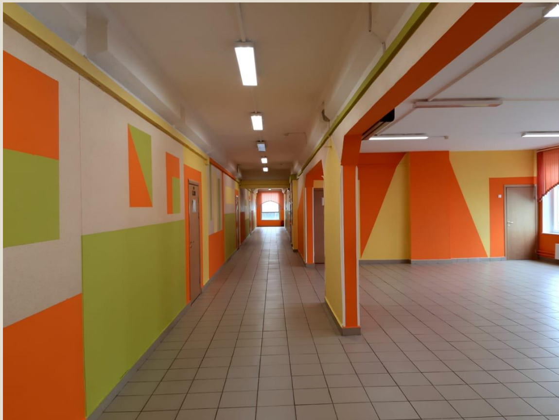
Ремонт 1 и 4-го этажей учебного корпуса