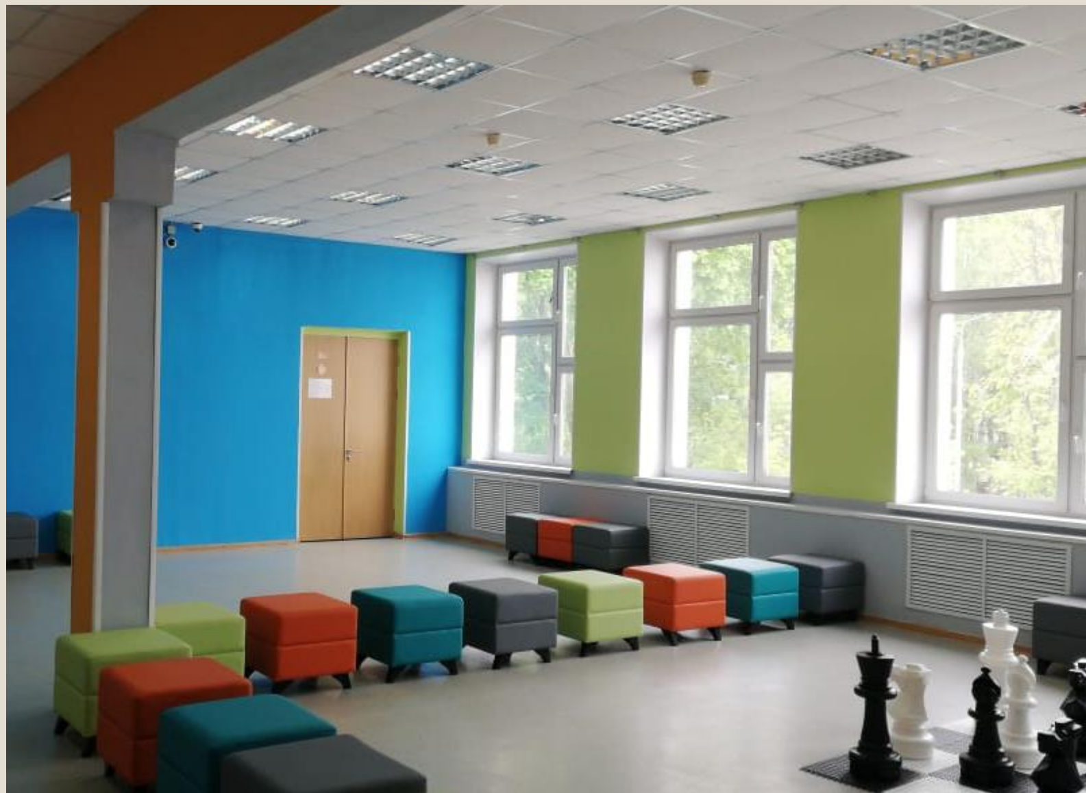
Ремонт рекреации 2 этажа